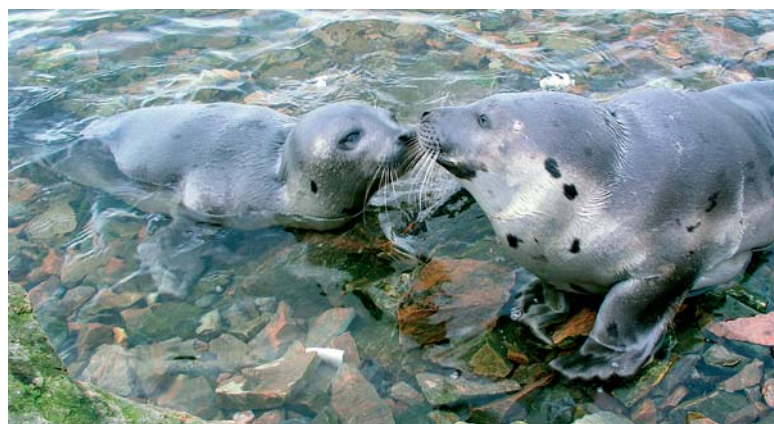
Mało płochliwe foki spotykane są tu niemal na każdym kroku

Najpiękniejszą rzeczą w nurkowaniu podlodowym jest sam lód. Ponieważ w Morzu Białym występują silne prądy, występuje tu różnica około 2 metrów w poziomie wody pomiędzy przyplływem i odpływem. Pływy występują z częstotnością co około 12 godzin. Mówiąc innymi słowami, przyplływ trwa z grubsza około 6 godzin i tyle samo trwa odpływ. Na skutek pływów lód wznosi się i opada wraz z wodą i kiedy napotyka po-